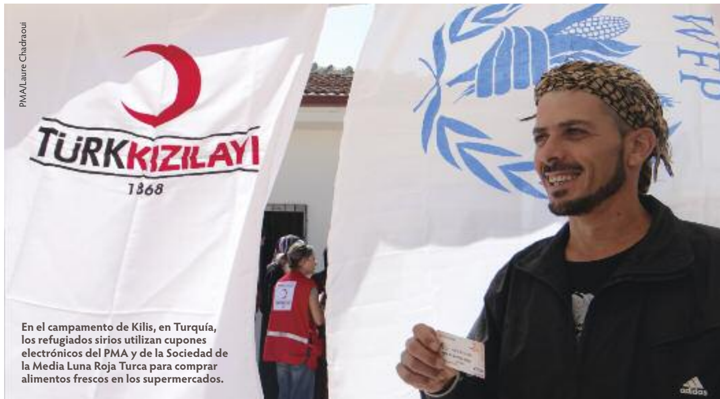
En el campamento de Kilis, en Turquía, los refugiados sirios utilizan cupones electrónicos del PMA y de la Sociedad de la Media Luna Roja Turca para comprar alimentos frescos en los supermercados.

En estos países y en otras partes del mundo, el PMA ayuda a las poblaciones a vivir y sobrellevar periodos difíciles en espera de que lleguen tiempos mejores.