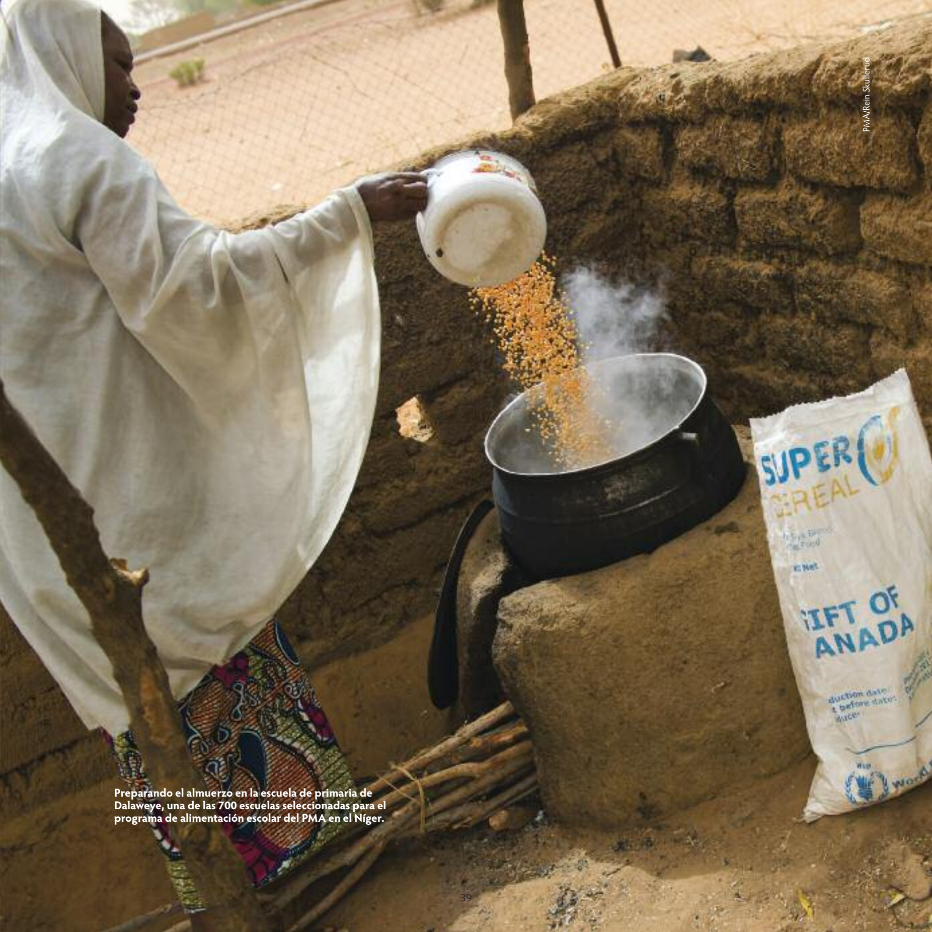
Preparando el almuerzo en la escuela de primaria de Dalaweye, una de las 700 escuelas seleccionadas para el programa de alimentación escolar del PMA en el Níger.