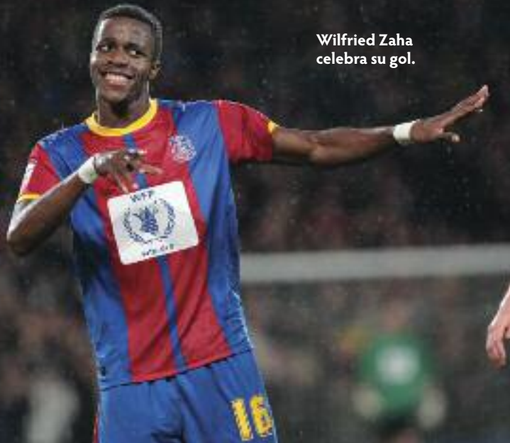
Wilfried Zaha celebra su gol.