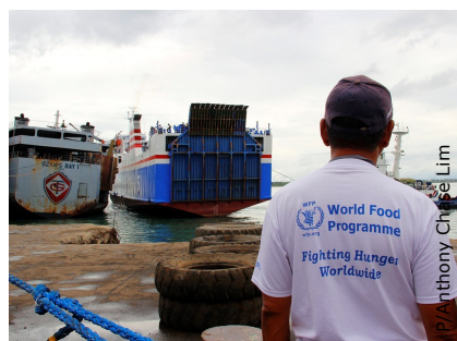
PMA/Anthony Chrise Lim