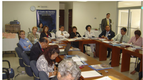
Talleres nacionales de expertos