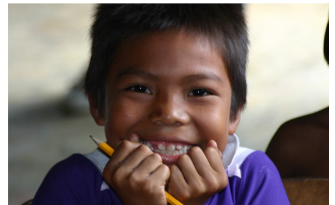
Invertir en nutrición también tiene un impacto positivo en la capacidad productiva de un país