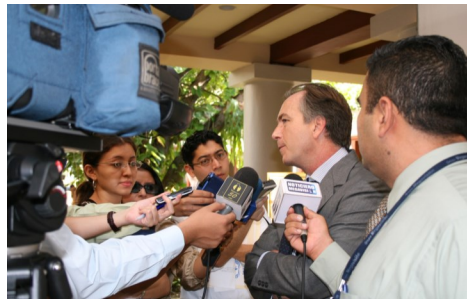
Los datos del estudio permitieron realizar sensibilización al más alto nivel en la región