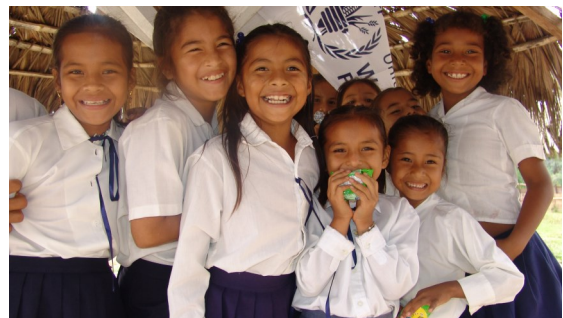
Impacto a nivel del capital humano