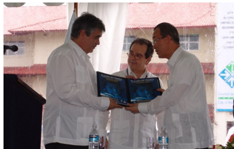
El Secretario General de la ONU, lanzó el Costo del Hambre durante su visita a la región