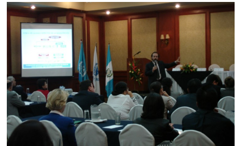
Lanzamiento del Costo del Hambre con los gobiernos en los distintos países