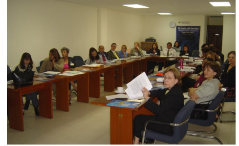
Equipos técnicos de gobierno y ONGs en cada país validaron los resultados del estudio