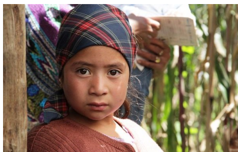
El conocimiento nutricional se pasa de madre a hijos y eventualmente se esparce por toda la comunidad.