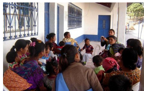
Las mujeres embarazadas y madres jóvenes reciben apoyo de sus compañeras en la reunión.