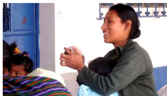
Madre consejera facilitando grupo madre a madre