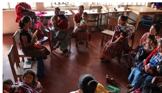
Grupos de apoyo madre a madre