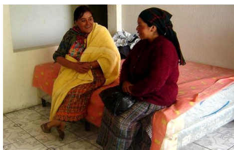
Las madres consejeras son responsables de realizar visitas domiciliarias al momento del parto y en caso de enfermedad.