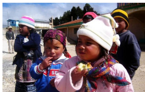
Que las mujeres aprendan sobre una alimentación adecuada es importante para reducir la desnutrición.