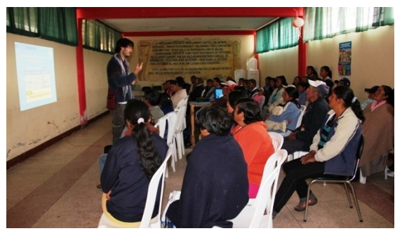
Capacitación en nutrición

Gracias al uso del código de barras, el cupón se recarga en forma virtual. Los puntos de venta leen su información digitalmente, ahorrando tiempo al PMA y sus socios. En el proceso de mejorar los hábitos alimenticios, este sistema ayuda al PMA a verificar por cuáles alimentos se canjea y en qué cantidad.