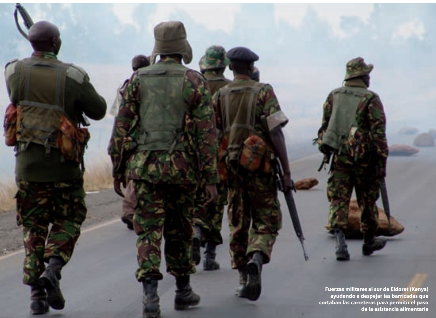
Fuerzas militares al sur de Eldoret (Kenia) ayudando a despejar las barricadas que cortaban las carreteras para permitir el paso de la asistencia alimentaria

La operación tuvo lugar cuando buena parte de las zonas septentrionales y orientales de Kenia estaban sufriendo una gravísima sequía que afectaba a unas 900.000 personas. Asimismo, debido a la situación reinante al otro lado de la frontera con Somalia, un número importante de refugiados, unas 60.000 personas, cruzaron a Kenia, lo que planteó un desafío adicional para el PMA en el país.