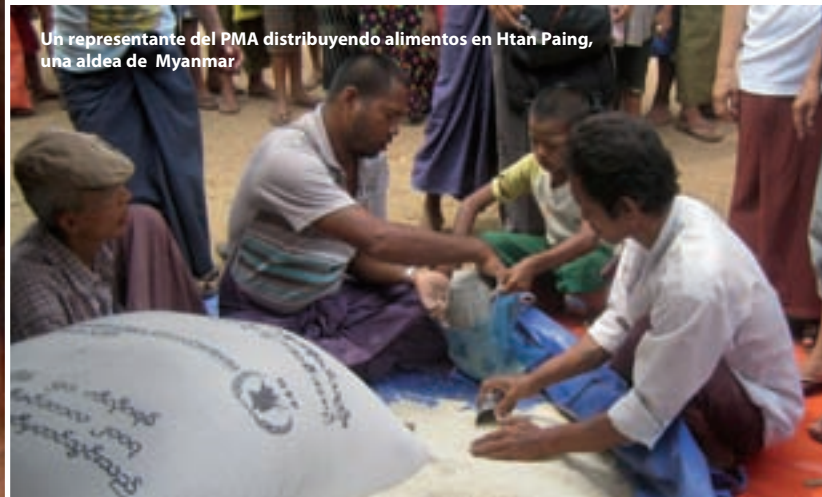
Un representante del PMA distribuyendo alimentos en Htan Paing, una aldea de Myanmar

La función principal del PMA siguió siendo responder a emergencias, particularmente las causadas por fenómenos meteorológicos extremos y catástrofes naturales relacionados con el cambio climático. El PMA puso en marcha 22 operaciones de socorro independientes para las víctimas de sequías, inundaciones, terremotos y diversos tipos de temporales de viento, a saber, ciclones, huracanes y tifones.