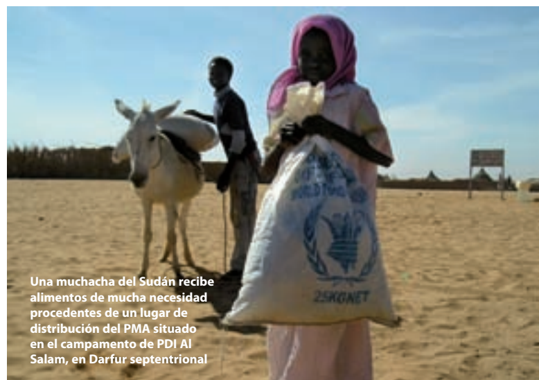
Una muchacha del Sudán recibe alimentos de mucha necesidad procedentes de un lugar de distribución del PMA situado en el campamento de PDI Al Salam, en Darfur septentrional

El número de donantes que aportan contribuciones al PMA ha seguido aumentando y al final del año llegó a 98. De los países donantes, 66 no forman parte de la Organización de Cooperación y Desarrollo Económicos. Hubo nueve gobiernos que prestaron apoyo al PMA por primera vez: la Argentina, Burkina Faso, Burundi, el Iraq, Malí, México, la República de Guinea, la República Unida de Tanzania y Timor-Leste.