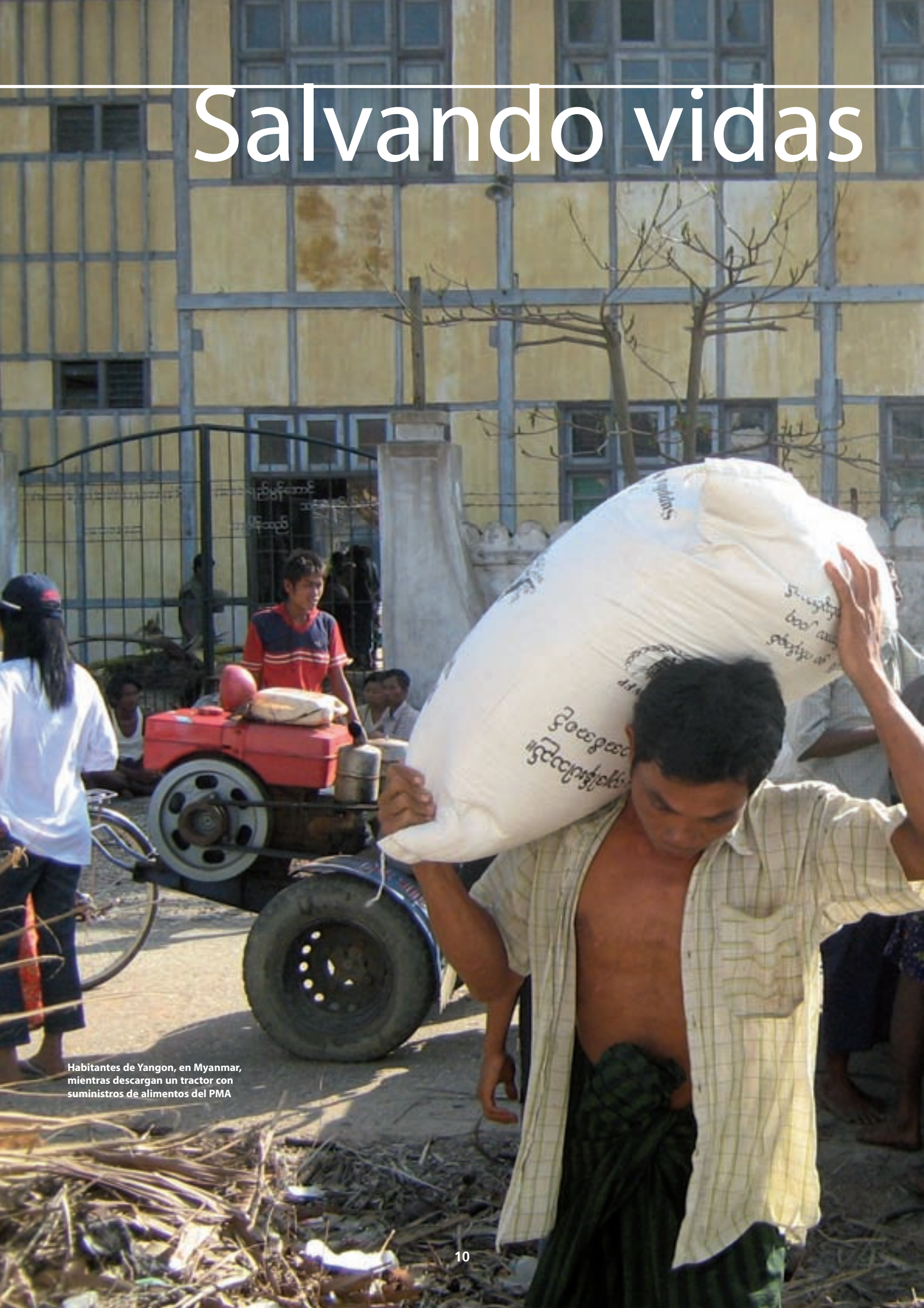
Habitantes de Yangon, en Myanmar, mientras descargan un tractor con suministros de alimentos del PMA