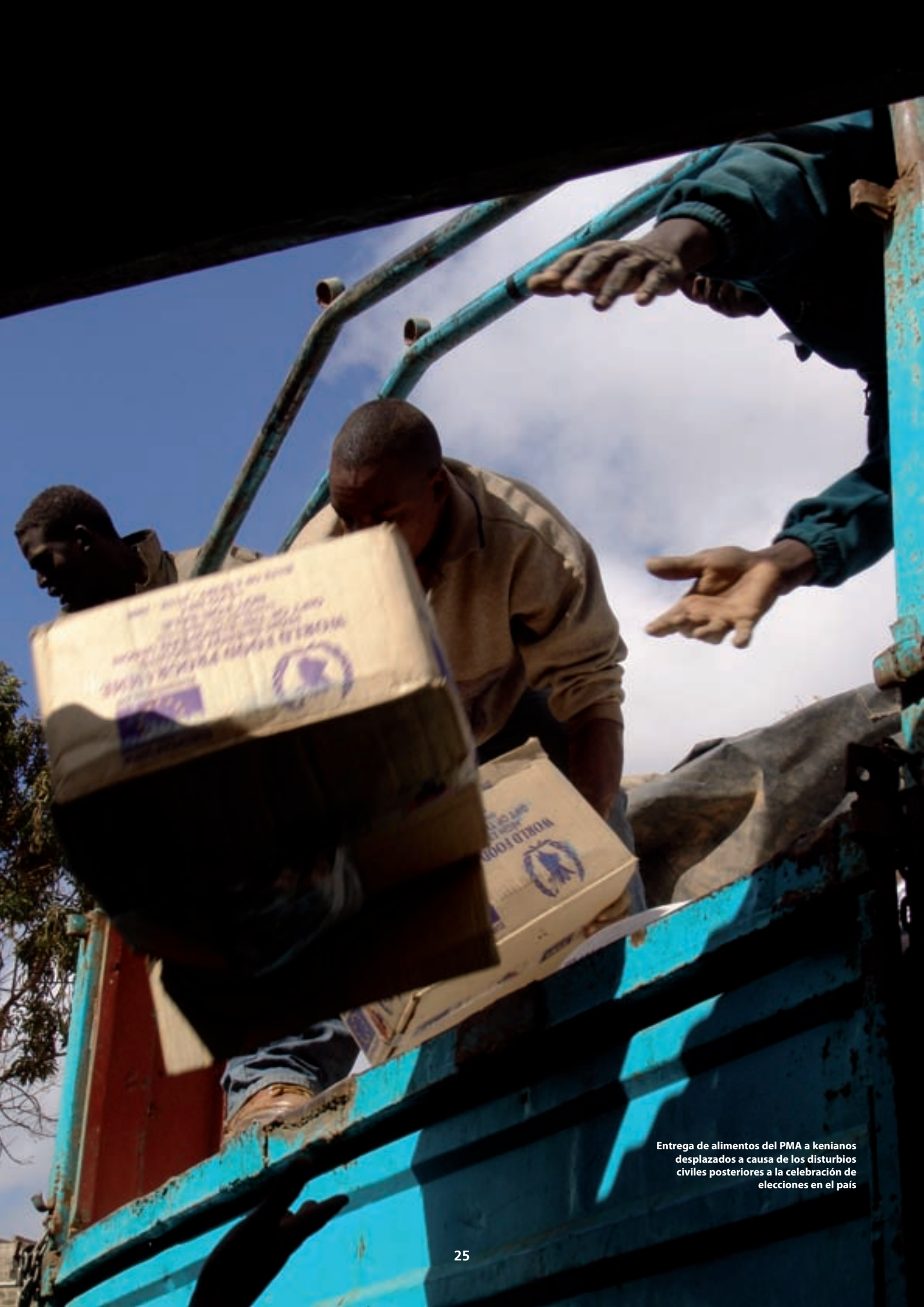
Entrega de alimentos del PMA a kenianos desplazados a causa de los disturbios civiles posteriores a la celebración de elecciones en el país