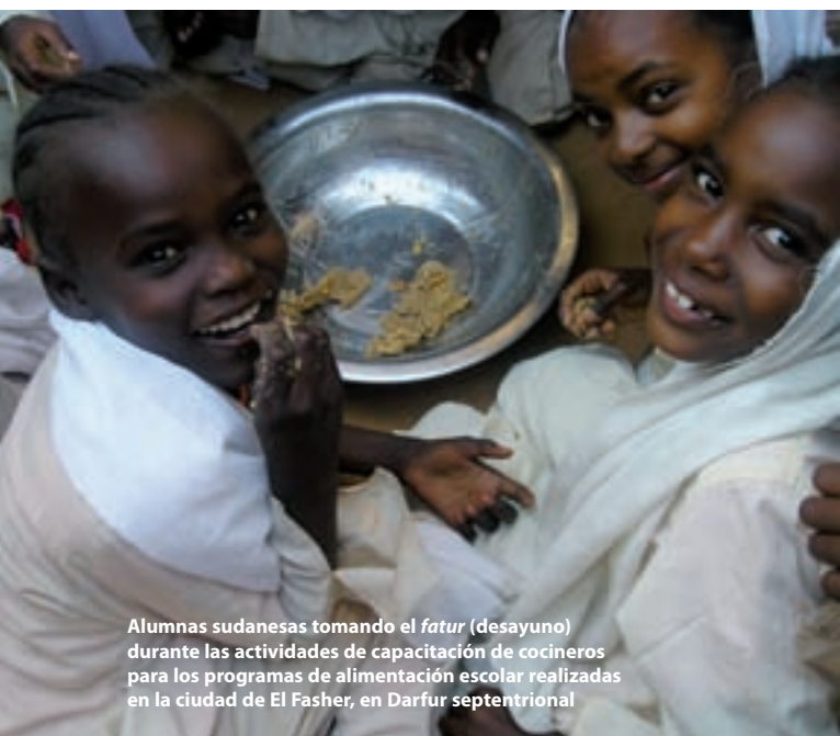
Alumnas sudanesas tomando el fatur (desayuno) durante las actividades de capacitación de cocineros para los programas de alimentación escolar realizadas en la ciudad de El Fasher, en Darfur septentrional

Teniendo en cuenta el actual clima de seguridad en Darfur, la ejecución de un programa efectivo de alimentación suplementaria sigue planteando considerables desafíos, particularmente en zonas rurales que carecen de infraestructura para dispensar atención de salud. No obstante, el PMA está preparado para aceptar el desafío de mejorar las vidas y los medios de subsistencia de los 6 millones de personas que reciben asistencia del Programa en el Sudán, incluidos los 3 millones de Darfur.