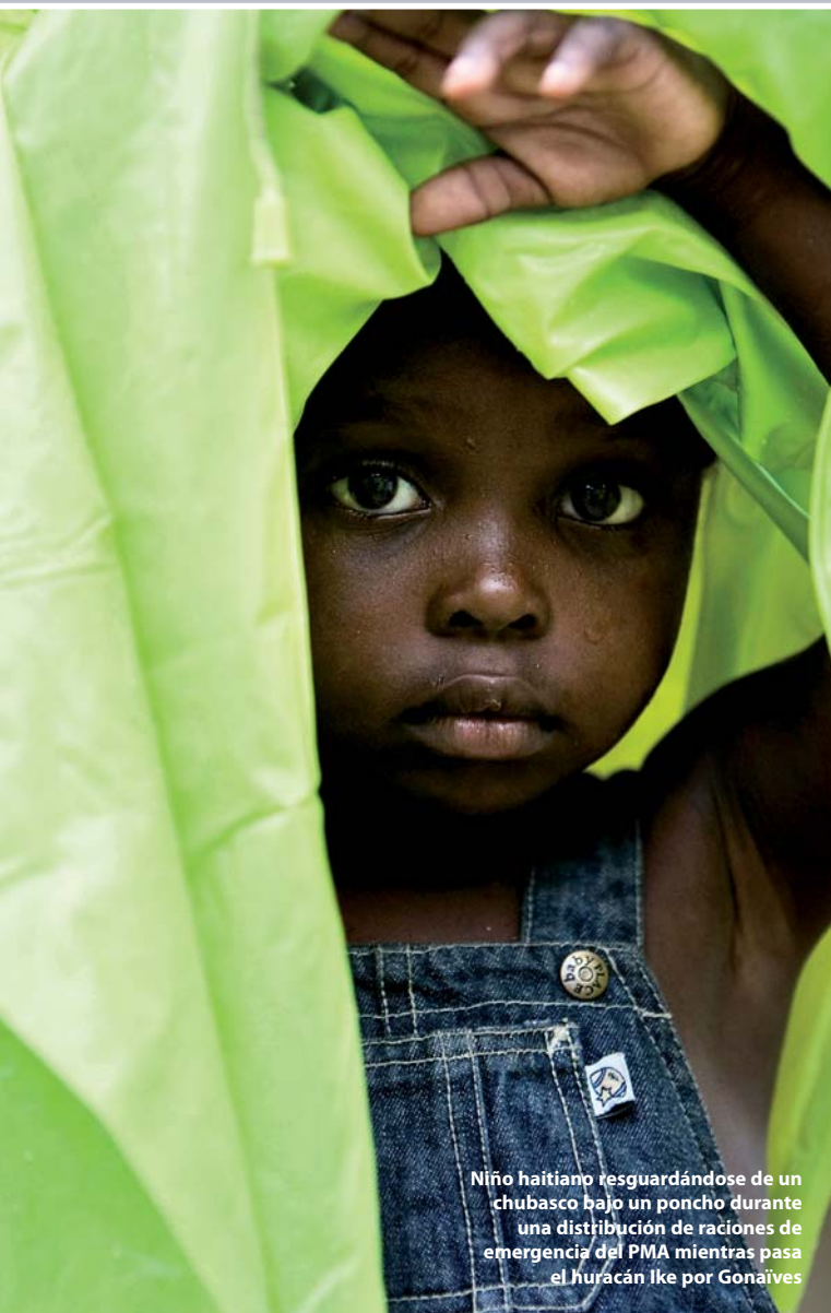
Niño haitiano resguardándose de un chubasco bajo un poncho durante una distribución de raciones de emergencia del PMA mientras pasa el huracán Ike por Gonaïves