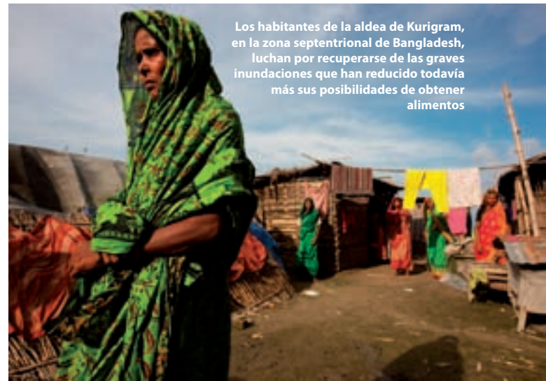
Los habitantes de la aldea de Kurigram, en la zona septentrional de Bangladesh, luchan por recuperarse de las graves inundaciones que han reducido todavía más sus posibilidades de obtener alimentos

DSM, una empresa asociada a nivel mundial, además de producir las nuevas bolsitas de micronutrientes en polvo para el enriquecimiento casero de los alimentos, ha incrementado su compromiso con el PMA mediante su apoyo directo a las víctimas del ciclón en Bangladesh.