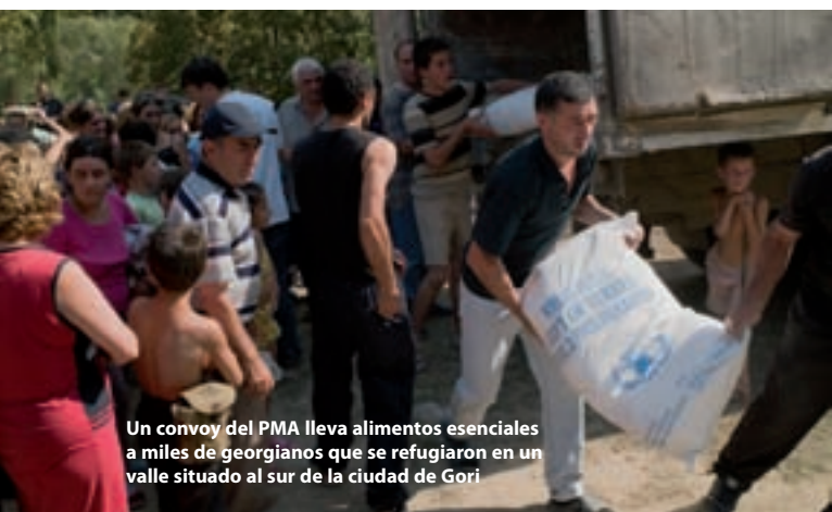
Un convoy del PMA lleva alimentos esenciales a miles de georgianos que se refugiaron en un valle situado al sur de la ciudad de Gori

El 18 de agosto, las Naciones Unidas iniciaron un llamamiento urgente para recaudar 59,7 millones de dólares con el fin de atender por un período de seis meses las necesidades humanitarias resultantes del conflicto. En ese llamamiento las necesidades correspondientes al sector alimentario se estimaron en 15,8 millones de dólares, incluidos 12,9 millones de dólares para que el PMA suministrara raciones básicas de alimentos. A principios de octubre se emitió un llamamiento revisado en el que las necesidades del sector alimentario se situaban en 32 millones de dólares, de los que 20 millones correspondían al PMA. El PMA también lanzó un llamamiento para obtener 2,5 millones de dólares con el fin de apoyar la coordinación en materia de logística y la capacidad interinstitucional de almacenamiento y transporte.