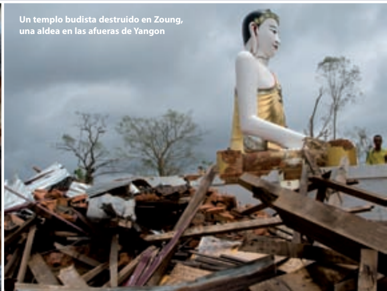
Un templo budista destruido en Zoung, una aldea en las afueras de Yangon