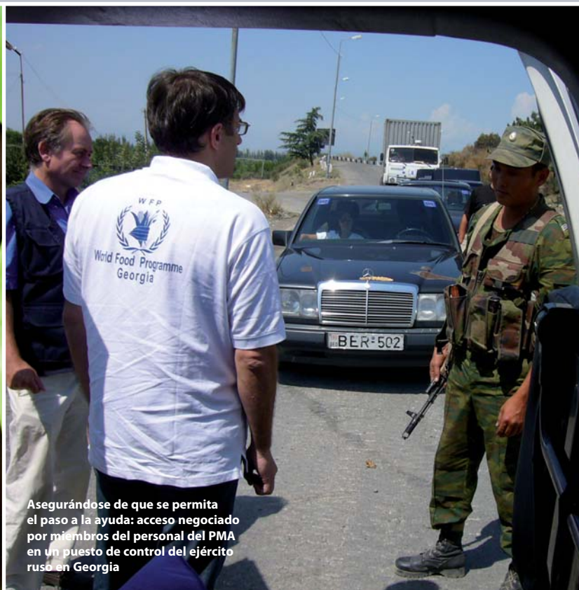
Asegurándose de que se permita el paso a la ayuda: acceso negociado por miembros del personal del PMA en un puesto de control del ejército ruso en Georgia

personal del PMA murieron y 17 resultaron heridos a causa de actos intencionados. Nuestros contratistas y asociados también pagaron un precio elevado: siete conductores de camiones contratados por el PMA murieron por disparos durante ataques de bandidos en el Sudán, otros cinco murieron en ataques similares en Somalia y uno más en Filipinas. También se registraron ataques contra camiones contratados por el PMA en el Afganistán, la República Democrática del Congo, Mindanao (Filipinas) y el Pakistán.