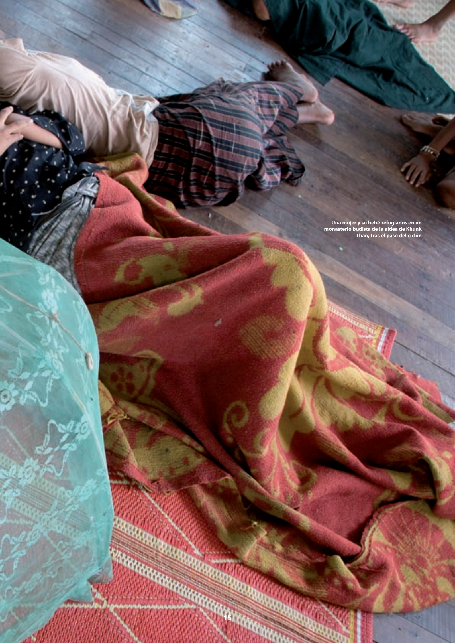
Una mujer y su bebé refugiados en un monasterio budista de la aldea de Khunk Than, tras el paso del ciclón