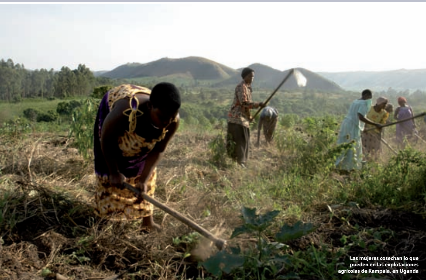
Las mujeres cosechan lo que pueden en las explotaciones agrícolas de Kampala, en Uganda

emergencias en desastres como los de Haití y Myanmar. Gracias al apoyo de TNT, el PMA pudo tener una presencia destacada en el Foro Económico Mundial de Davos.