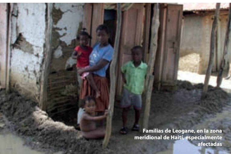
Familias de Leogane, en la zona meridional de Haití, especialmente afectadas

En el marco de una OEM de 31 millones de dólares, el PMA logró alcanzar a 800.000 personas que habían perdido sus medios de subsistencia. El PMA hizo distribuciones generales de alimentos, amplió los programas de alimentación escolar y de alimentación