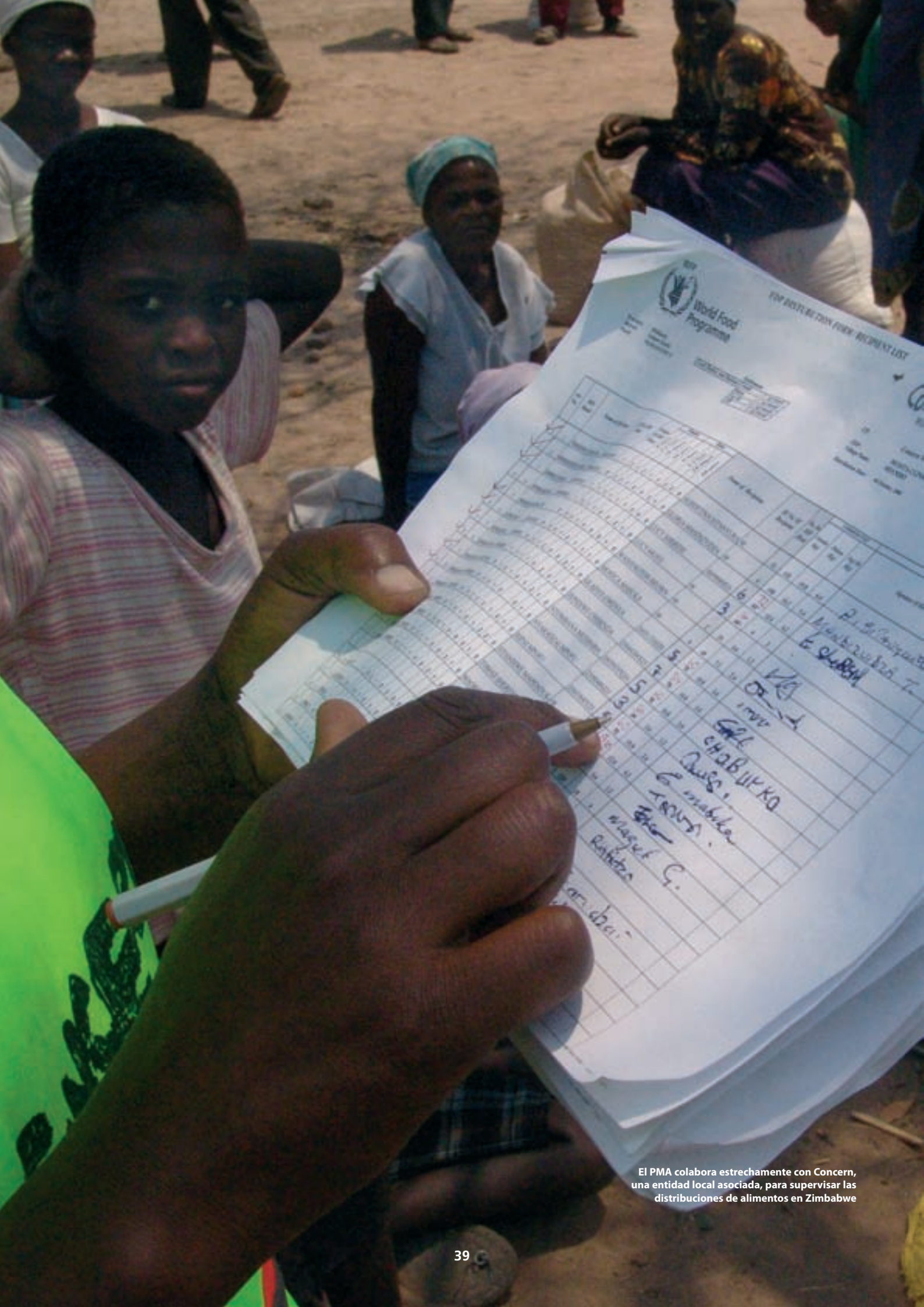
El PMA colabora estrechamente con Concern, una entidad local asociada, para supervisar las distribuciones de alimentos en Zimbabwe