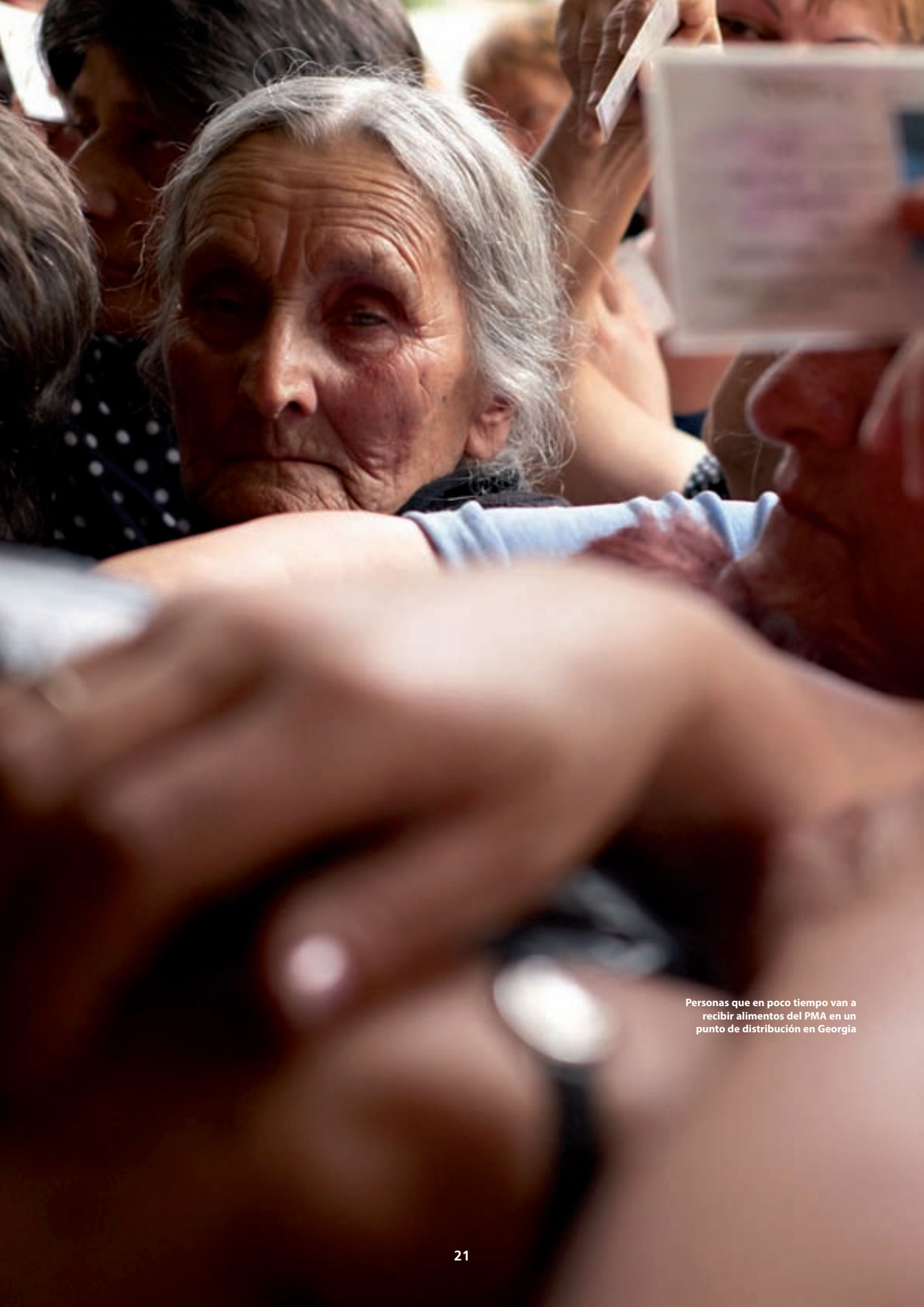
Personas que en poco tiempo van a recibir alimentos del PMA en un punto de distribución en Georgia