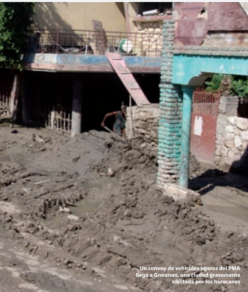
Un convoy de vehículos ligeros del PMA llega a Gonaïves, una ciudad gravemente afectada por los huracanes

suplementaria y patrocinó diversas iniciativas de alimentos por trabajo en situaciones posteriores a una catástrofe para reconstruir instalaciones de infraestructuras vitales.