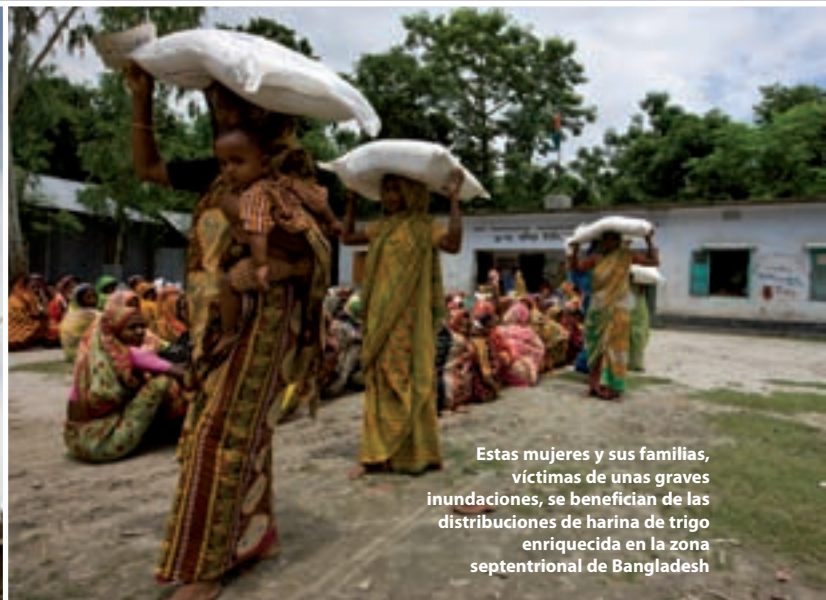
Estas mujeres y sus familias, víctimas de unas graves inundaciones, se benefician de las distribuciones de harina de trigo enriquecida en la zona septentrional de Bangladesh

Desde 2001, 1,3 millones de mujeres han recibido capacitación en materia de preparación para casos de desastre y se han construido 30.000 casas en terreno más elevado: 4.000 de ellas en el marco del