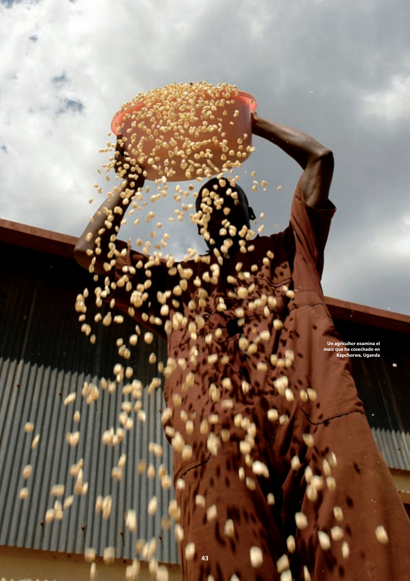
Un agricultor examina el maíz que ha cosechado en Kapchorwa, Uganda