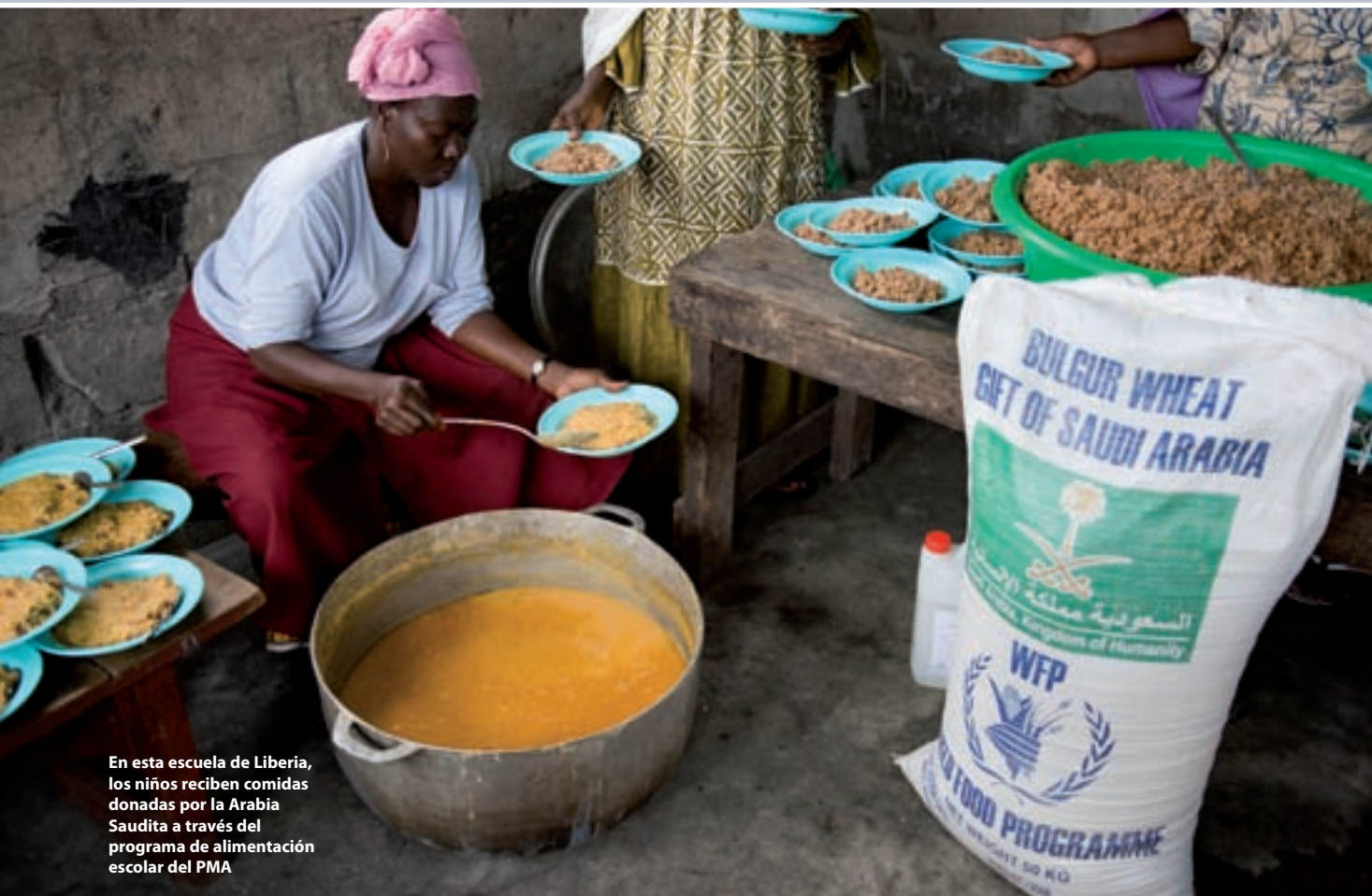
En esta escuela de Liberia, los niños reciben comidas donadas por la Arabia Saudita a través del programa de alimentación escolar del PMA

Una novedad que es causa de satisfacción es el incremento de las contribuciones de los países receptores. En 2008, 38 gobiernos donantes que también eran receptores de la asistencia del PMA suministraron 140 millones de dólares, lo que supone un incremento respecto de los 56 millones de dólares aportados por 20 países receptores en 2003.