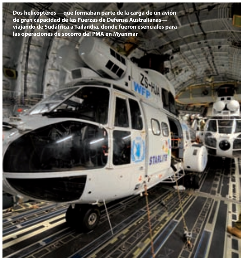
Dos helicópteros —que formaban parte de la carga de un avión de gran capacidad de las Fuerzas de Defensa Australianas— viajando de Sudáfrica a Tailandia, donde fueron esenciales para las operaciones de socorro del PMA en Myanmar

En otros lugares, el PMA mantuvo su colaboración con la empresa de logística TNT, que suministró capacitación en materia de servicios aéreos a 290 participantes del PMA, otros organismos de las Naciones Unidas, ONG y entidades nacionales responsables de la aviación civil. El PMA siguió ampliando su colaboración con el Comité Internacional de la Cruz Roja en operaciones sobre el terreno y en materia de seguridad aérea. La dependencia encargada de la seguridad de los servicios aéreos del PMA también desempeñó una función dinámica en la mejora de la capacidad de las autoridades responsables de la aviación civil de África y Asia e impartió cursos de gestión de la seguridad junto con la Organización de Aviación Civil Internacional.