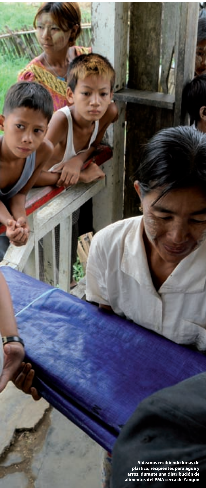
Aldeanos recibiendo lonas de plástico, recipientes para agua y arroz, durante una distribución de alimentos del PMA cerca de Yangon