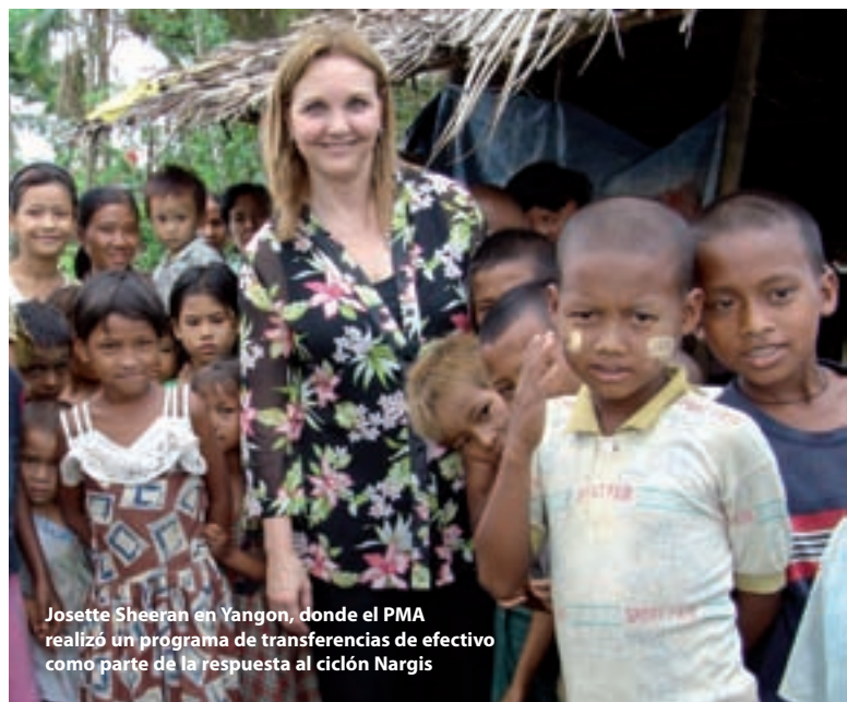
Josette Sheeran en Yangon, donde el PMA realizó un programa de transferencias de efectivo como parte de la respuesta al ciclón Nargis

Aprovechando las mejores prácticas a nivel mundial, el año pasado introdujimos en el conjunto de instrumentos de nuestro Plan Estratégico programas innovadores de alimentación selectiva con fines de protección social, como las iniciativas de salud y nutrición materno-infantiles; las transferencias de efectivo y la entrega de cupones para alimentos con arreglo a criterios selectivos; las compras de alimentos a nivel local, y la alimentación escolar. En Haití, por