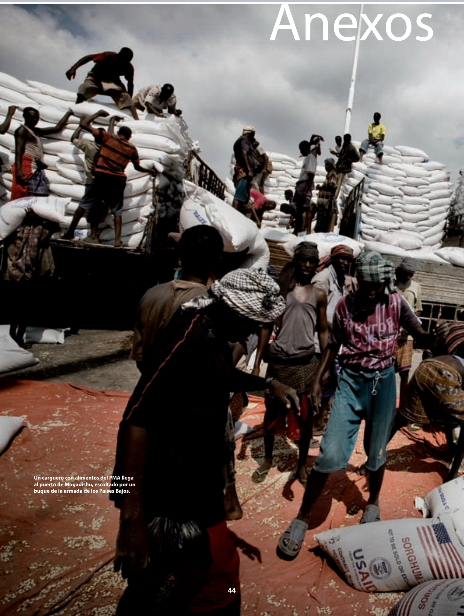
Un carguero con alimentos del PMA llega al puerto de Mogadishu, escoltado por un buque de la armada de los Países Bajos.