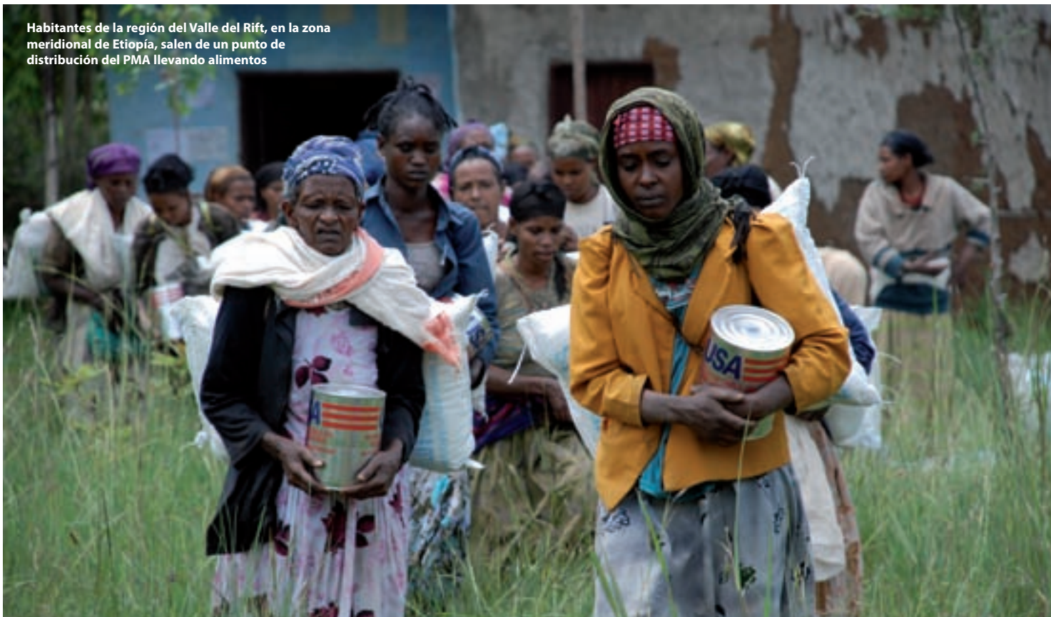
Habitantes de la región del Valle del Rift, en la zona meridional de Etiopía, salen de un punto de distribución del PMA llevando alimentos

Entre el gran número de actividades del programa se cuentan disposiciones para construir y rehabilitar caminos secundarios, reforestar laderas yermas, restablecer los manantiales y los