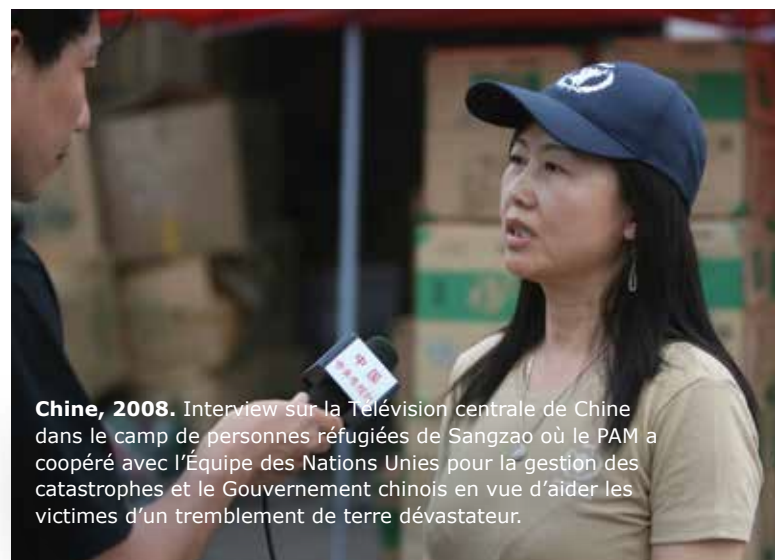
Chine, 2008. Interview sur la Télévision centrale de Chine dans le camp de personnes réfugiées de Sangzao où le PAM a coopéré avec l'Équipe des Nations Unies pour la gestion des catastrophes et le Gouvernement chinois en vue d'aider les victimes d'un tremblement de terre dévastateur.

59. L'indépendance éditoriale exige des médias qu'ils gardent une distance, et exclut toute possibilité de partenariat véritable. En revanche, la qualité des relations que le PAM établit avec ces organismes peut considérablement améliorer sa capacité de s'attacher des soutiens et de mobiliser des ressources. Le PAM collabore activement avec les médias traditionnels et numériques par l'intermédiaire des spécialistes en poste dans ses bureaux et de chargés de l'information officiant dans les capitales des donateurs et sur le terrain. La participation des médias est importante, car elle permet de sensibiliser aux activités du PAM, de faire connaître les priorités stratégiques de celui-ci et d'appuyer ses efforts de mobilisation de fonds en attirant l'attention sur les déficits de financement et les besoins en ressources, notamment lors des interventions menées à la suite de crises soudaines.