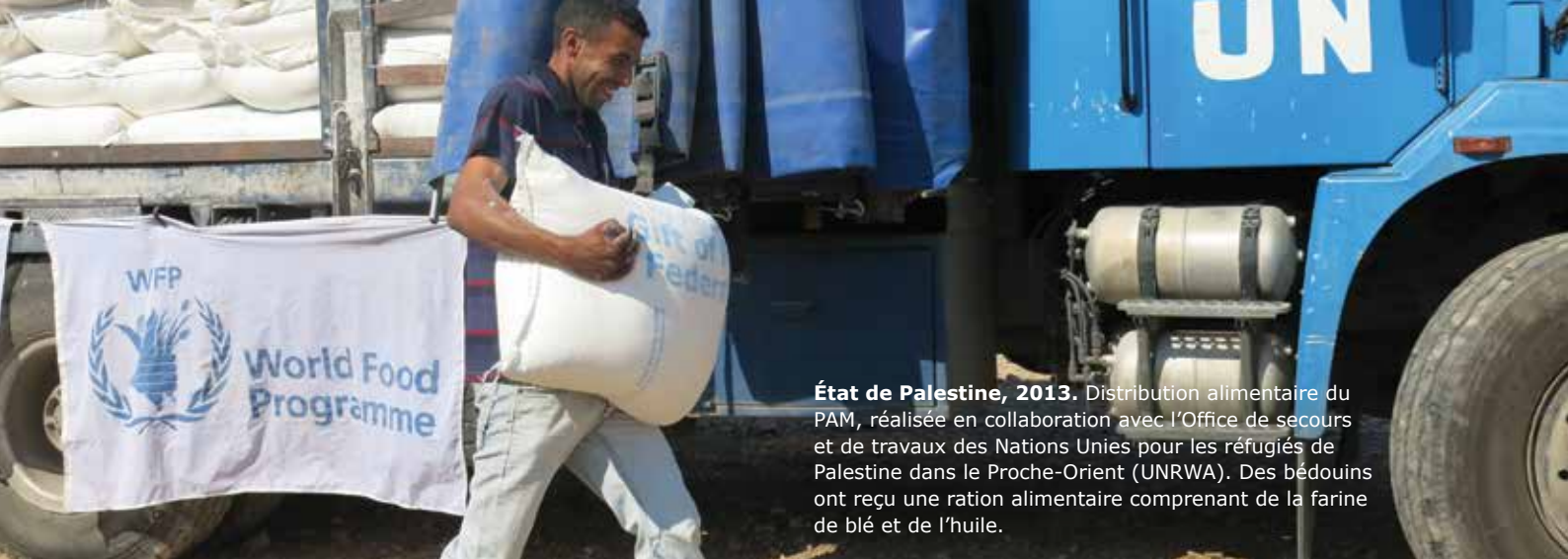
État de Palestine, 2013. Distribution alimentaire du PAM, réalisée en collaboration avec l'Office de secours et de travaux des Nations Unies pour les réfugiés de Palestine dans le Proche-Orient (UNRWA). Des bédouins ont reçu une ration alimentaire comprenant de la farine de blé et de l'huile.

grande cohérence de la collaboration à l'échelle du système. Tel qu'il est conçu, ce mécanisme aiderait à renforcer la responsabilisation ainsi que la cohérence, l'efficacité et l'ampleur des partenariats – au niveau mondial comme à celui des pays – et à instaurer un environnement propice à ce type de collaboration au sein du système des Nations Unies.