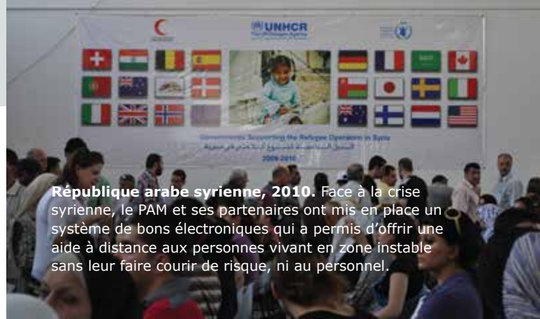
République arabe syrienne, 2010. Face à la crise syrienne, le PAM et ses partenaires ont mis en place un système de bons électroniques qui a permis d'offrir une aide à distance aux personnes vivant en zone instable sans leur faire courir de risque, ni au personnel.