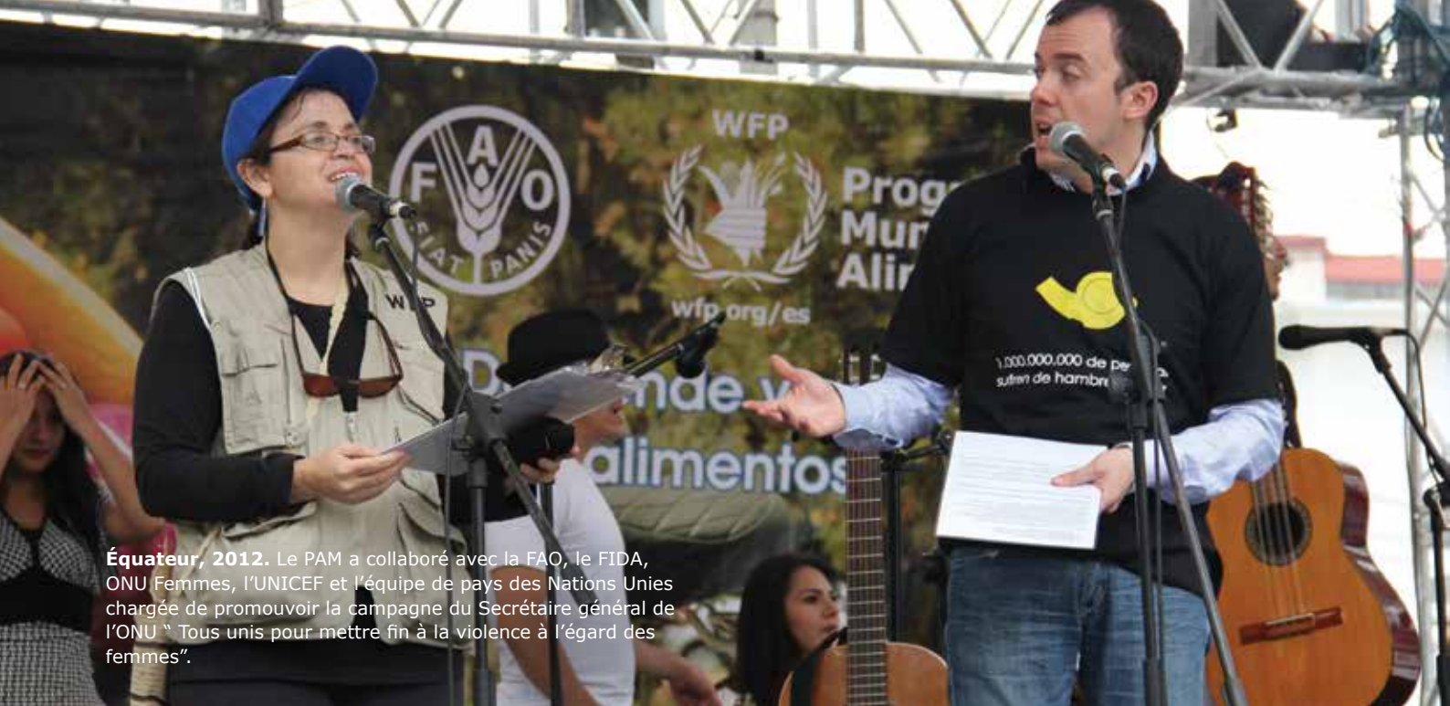
Équateur, 2012. Le PAM a collaboré avec la FAO, le FIDA, ONU Femmes, l'UNICEF et l'équipe de pays des Nations Unies chargée de promouvoir la campagne du Secrétaire général de l'ONU "Tous unis pour mettre fin à la violence à l'égard des femmes".

53. Sur la base de ce modèle, le PAM œuvrera en faveur de partenariats plus efficaces avec les organismes des Nations Unies: