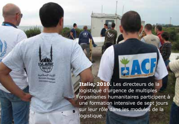
Italie, 2010. Les directeurs de la logistique d'urgence de multiples organismes humanitaires participent à une formation intensive de sept jours sur leur rôle dans les modules de la logistique.