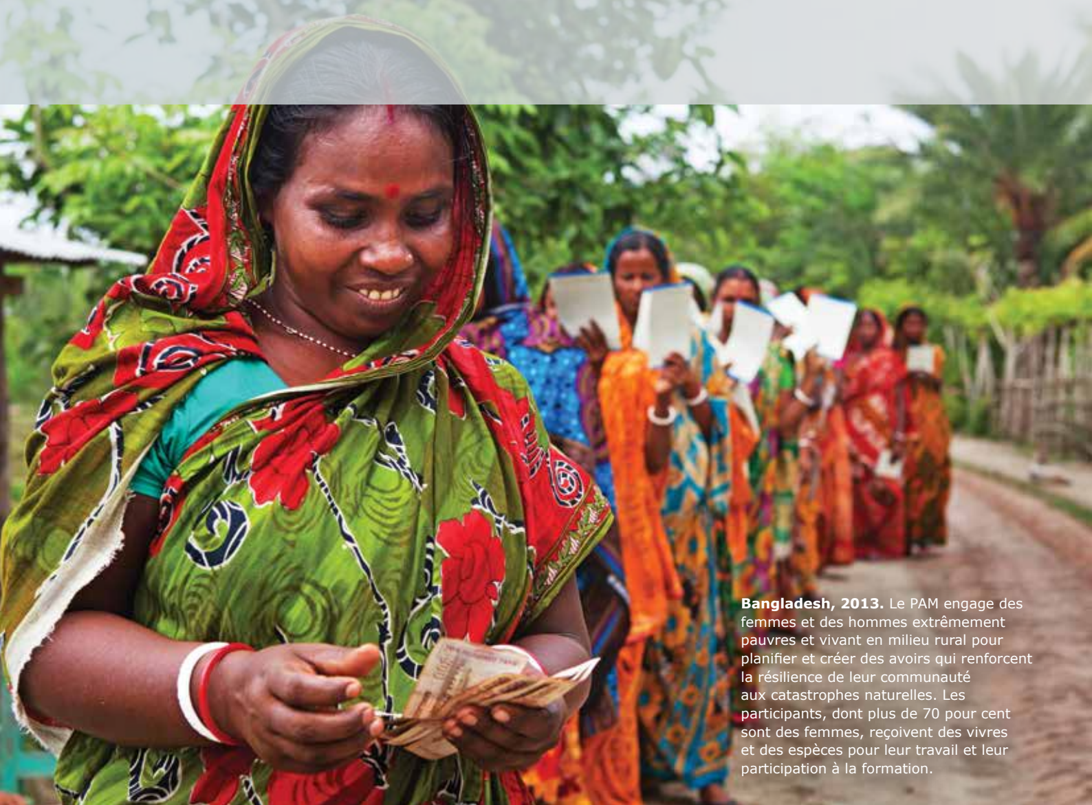
Bangladesh, 2013. Le PAM engage des femmes et des hommes extrêmement pauvres et vivant en milieu rural pour planifier et créer des avoirs qui renforcent la résilience de leur communauté aux catastrophes naturelles. Les participants, dont plus de 70 pour cent sont des femmes, reçoivent des vivres et des espèces pour leur travail et leur participation à la formation.

Les principales caractéristiques de la stratégie du PAM en matière de partenariat sont les suivantes: