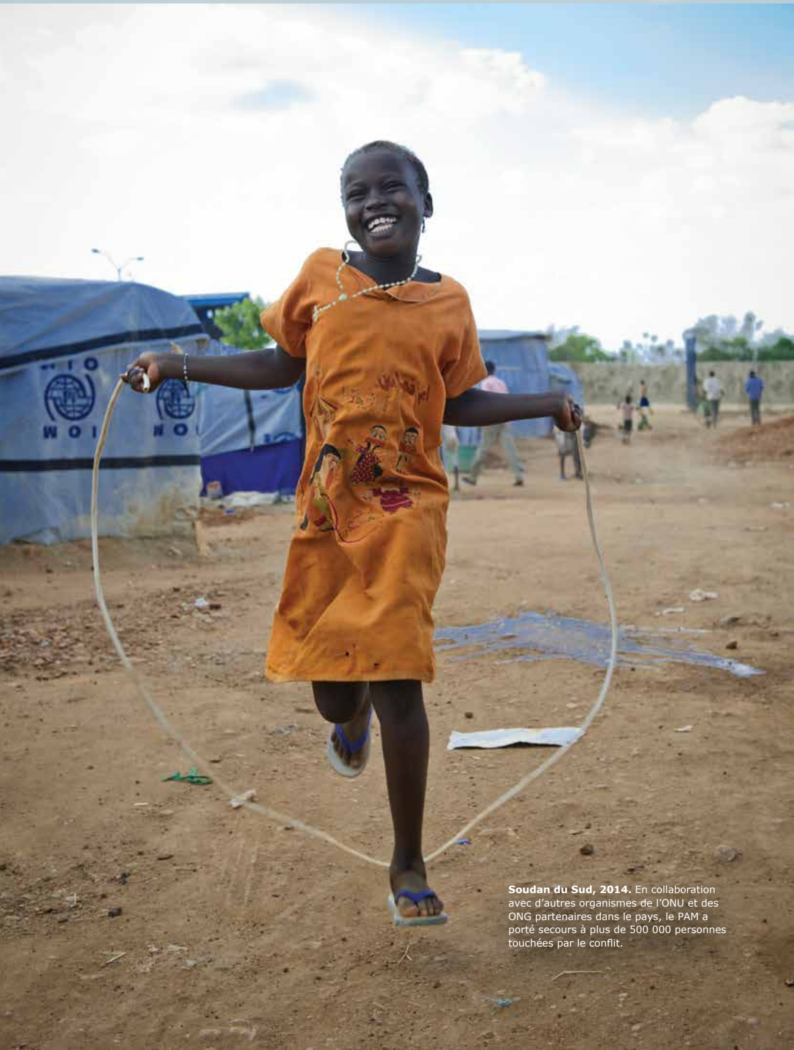
Soudan du Sud, 2014. En collaboration avec d'autres organismes de l'ONU et des ONG partenaires dans le pays, le PAM a porté secours à plus de 500 000 personnes touchées par le conflit.