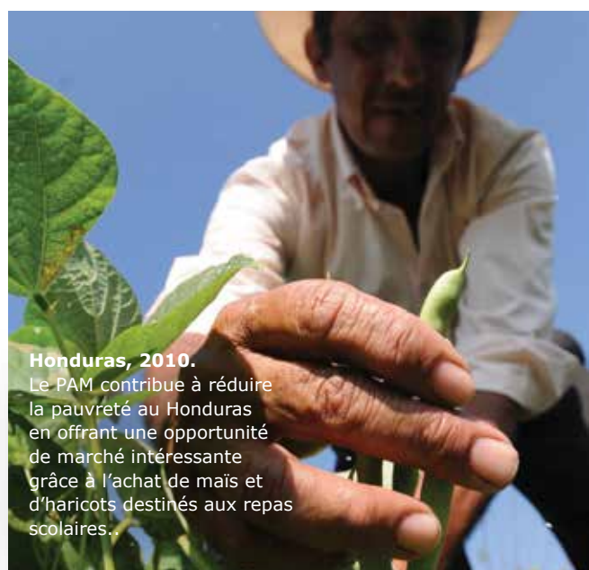
Honduras, 2010. Le PAM contribue à réduire la pauvreté au Honduras en offrant une opportunité de marché intéressante grâce à l'achat de maïs et d'haricots destinés aux repas scolaires...