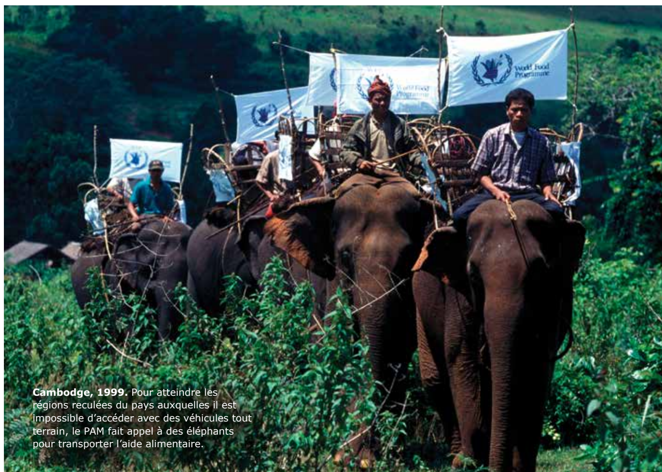
Cambodge, 1999. Pour atteindre les régions reculées du pays auxquelles il est impossible d'accéder avec des véhicules tout terrain, le PAM fait appel à des éléphants pour transporter l'aide alimentaire.