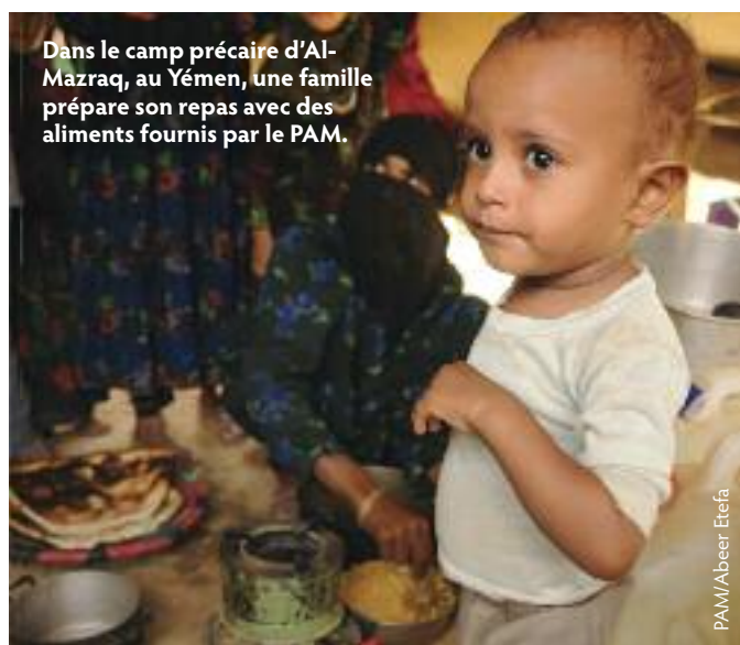
Dans le camp précaire d'Al-Mazraq, au Yémen, une famille prépare son repas avec des aliments fournis par le PAM.

Le Yémen, qui est le pays le plus pauvre du monde arabe, a connu une année particulièrement difficile en 2012. Les conflits armés, l'instabilité politique et le prix élevé des produits alimentaires et des carburants ont constitué un cocktail meurtrier qui a alimenté une crise humanitaire de plus en plus profonde dans ce pays aux montagnes escarpées, aux plaines humides et aux vastes étendues désertiques. Aujourd'hui, plus de 10 millions de personnes - soit près de la moitié de la population du pays - souffrent de la faim ou sont au bord de la famine.