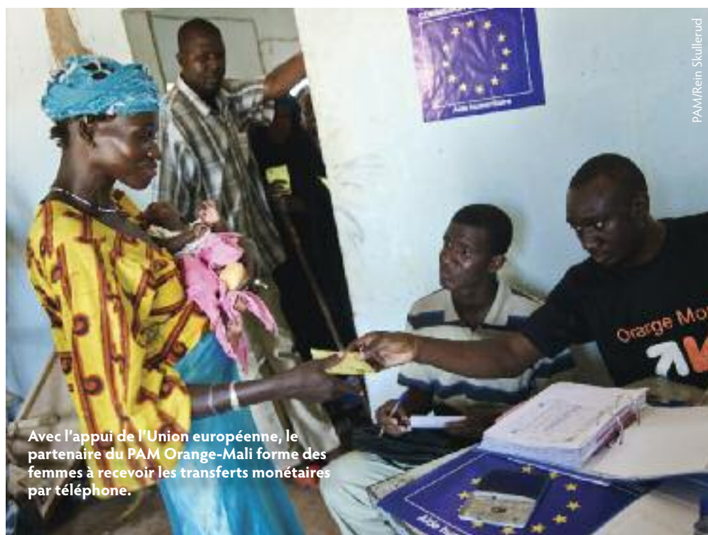
Avec l'appui de l'Union européenne, le partenaire du PAM Orange-Mali forme des femmes à recevoir les transferts monétaires par téléphone.

La reconstitution des stocks montre que le PAM sait agir vite et tôt. Quelques mois avant la crise, il avait acheté des centaines de milliers de tonnes de denrées alimentaires sur les marchés