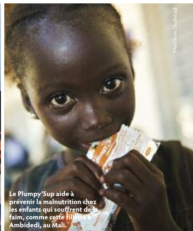
Le Plumpy'Sup aide à prévenir la malnutrition chez les enfants qui souffrent de la faim, comme cette fillette à Ambidedi, au Mali.