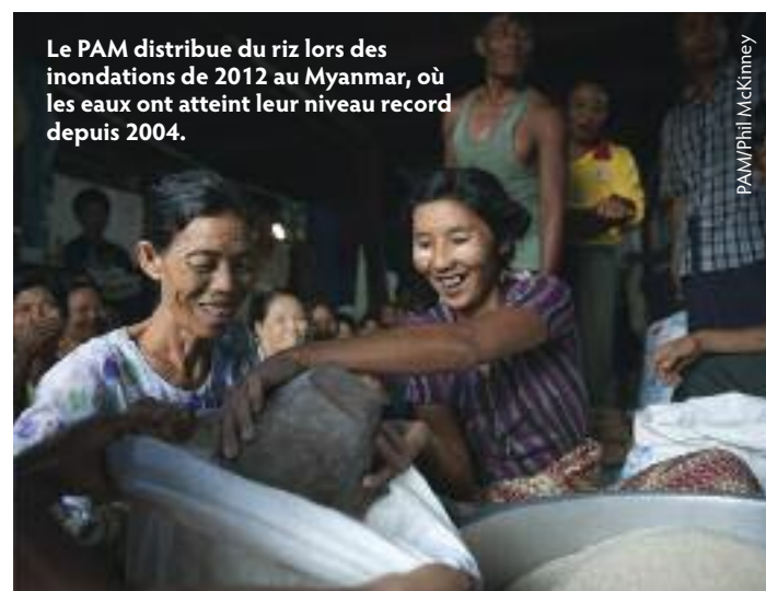
Le PAM distribue du riz lors des inondations de 2012 au Myanmar, où les eaux ont atteint leur niveau record depuis 2004.

Vers la fin de l'année, le PAM a lancé une opération d'assistance alimentaire initialement destinée à durer jusqu'en juin 2013, mais qui devrait être prolongée. "Le PAM continuera d'aider les personnes déplacées, mais nous devons aussi trouver le moyen de poursuivre l'action importante que nous menions déjà pour assurer aux plus démunis la disponibilité d'aliments nutritifs sur la table familiale", précise M. Veloso.