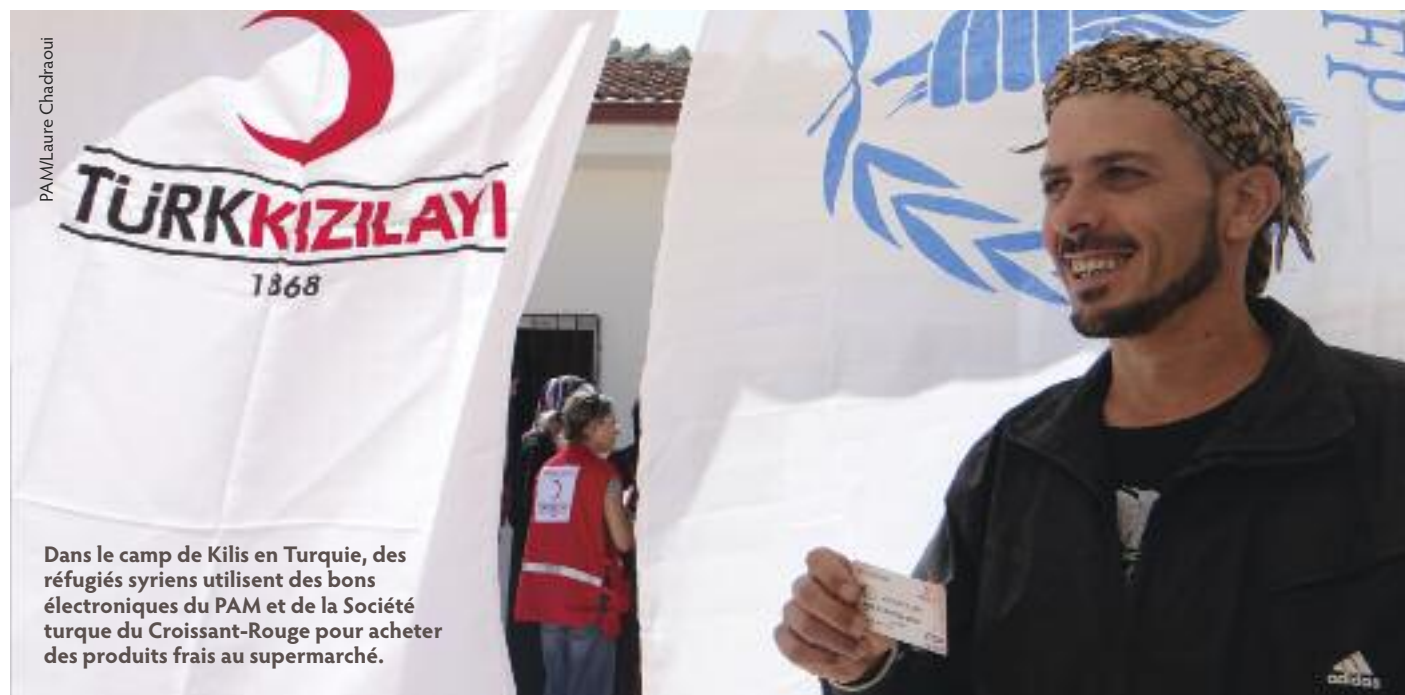
Dans le camp de Kilis en Turquie, des réfugiés syriens utilisent des bons électroniques du PAM et de la Société turque du Croissant-Rouge pour acheter des produits frais au supermarché.

Dans ces pays comme ailleurs, le PAM aide les populations à surmonter ces moments difficiles en attendant des jours meilleurs.