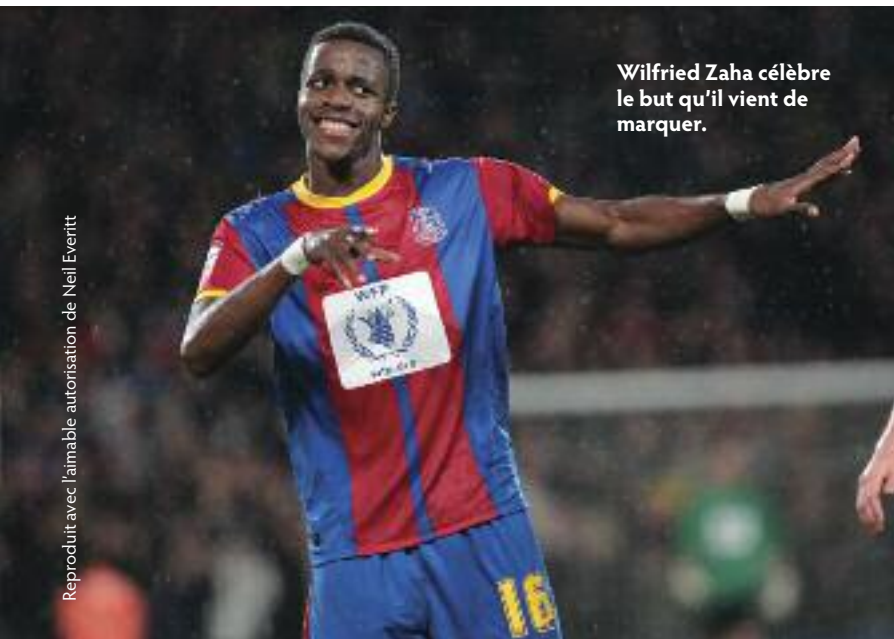
Wilfried Zaha célèbre le but qu'il vient de marquer.