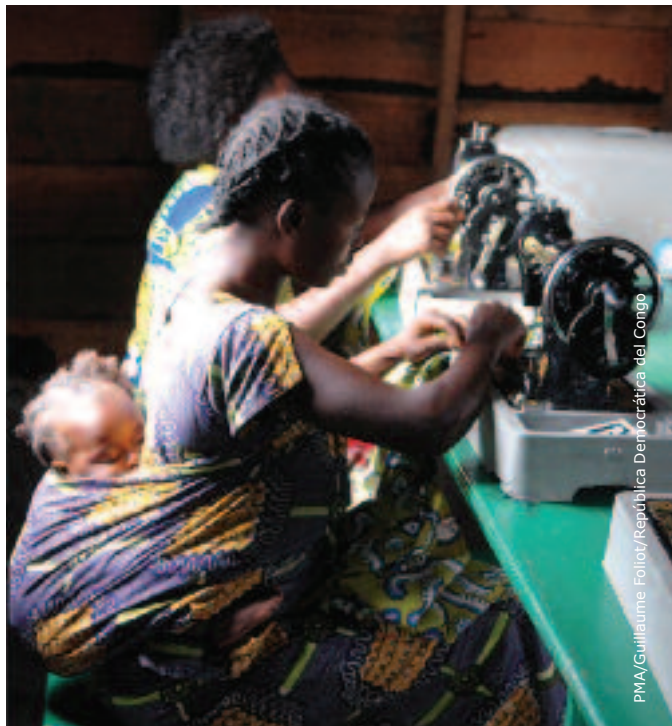
PMA/Guillaume Follot/República Democrática del Congo

El PMA se compromete a liberar a las mujeres de la inseguridad alimentaria. Además de la asistencia alimentaria de emergencia con que cada día el PMA salva la vida de muchas mujeres, existen numerosos programas en todo el mundo orientados a empoderar y proteger a las mujeres y las niñas.