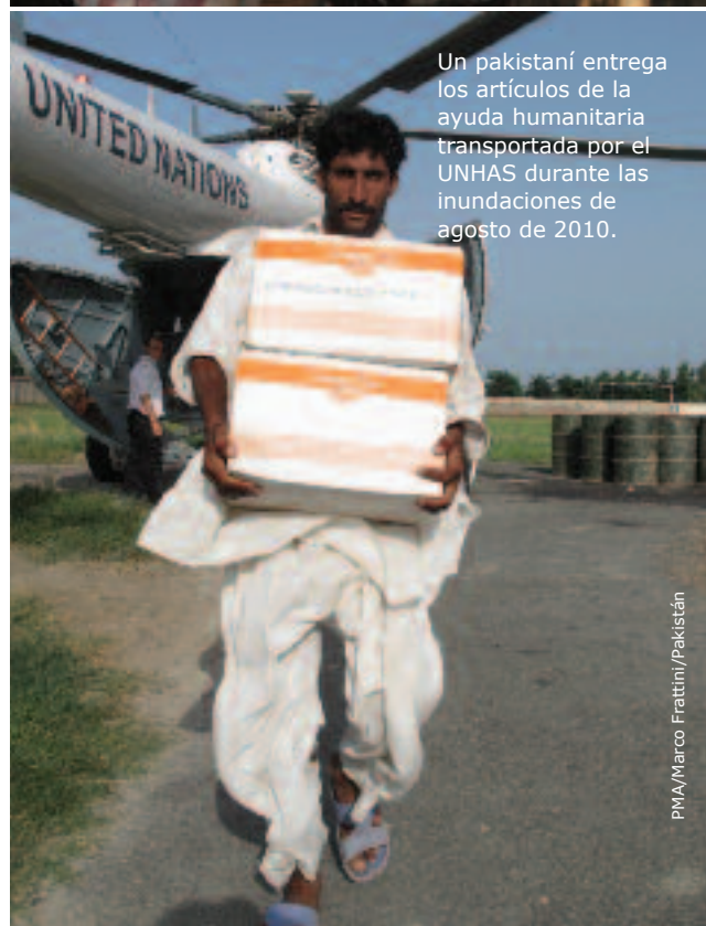
Un pakistaní entrega los artículos de la ayuda humanitaria transportada por el UNHAS durante las inundaciones de agosto de 2010.