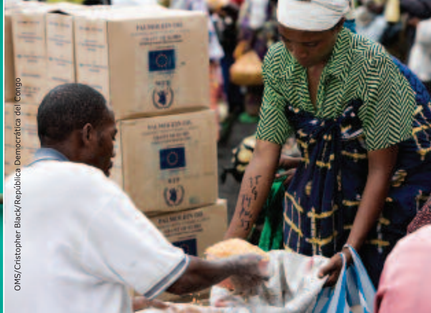
OMS/Cristopher Black/República Democrática del Congo