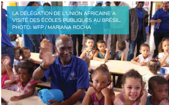
LA DÉLÉGATION DE L'UNION AFRICAINE A VISITÉ DES ÉCOLES PUBLIQUES AU BRÉSIL.

La délégation composée de ministres de l'éducation, de l'agriculture et des finances a découvert comment le Programme d'alimentation scolaire brésilien était structuré et financé et a visité des écoles et des agriculteurs familiaux pour comprendre les divers aspects impliqués dans l'implémentation du programme.