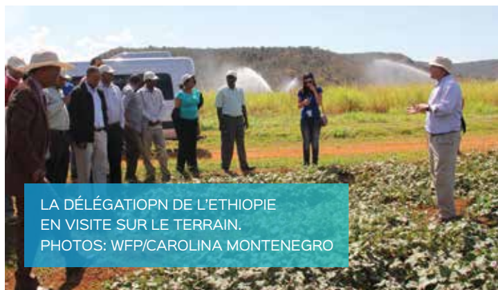
LA DÉLÉGATION DE L'ÉTHIOPIE EN VISITE SUR LE TERRAIN.

L'Éthiopie a fait deux missions d'études au Brésil en 2015, en plus des autres réalisées en 2013. Du 23 au 30 mars, une délégation éthiopienne a visité des écoles et des propriétés rurales, pour