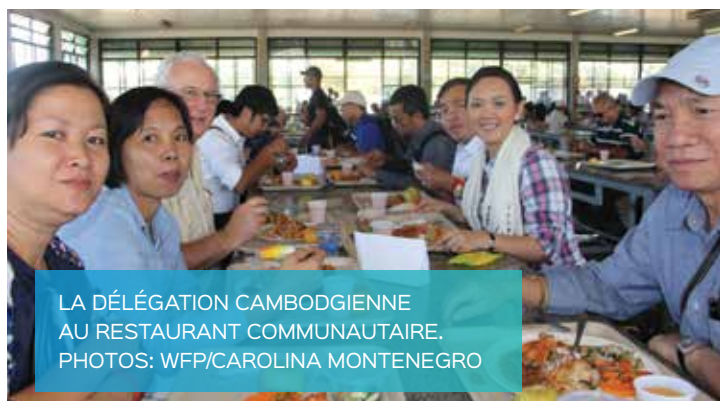
LA DÉLÉGATION CAMBODGIENNE AU RESTAURANT COMMUNAUTAIRE.