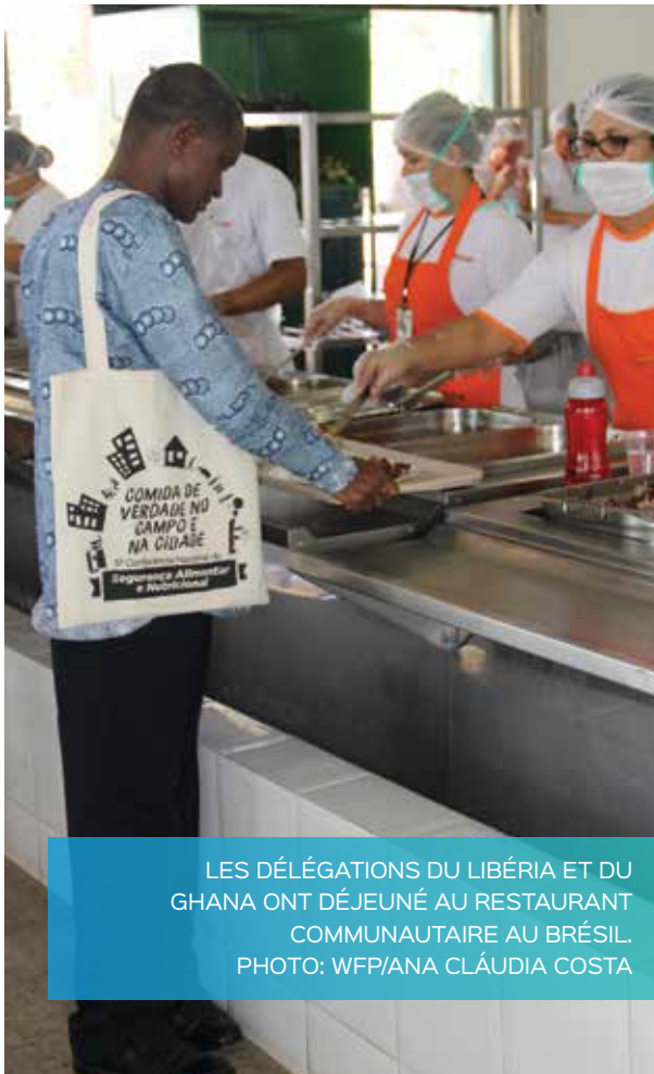
LES DÉLÉGATIONS DU LIBÉRIA ET DU GHANA ONT DÉJEUNÉ AU RESTAURANT COMMUNAUTAIRE AU BRÉSIL.