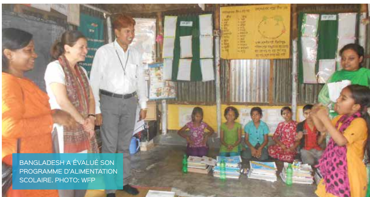
BANGLADESH A ÉVALUÉ SON PROGRAMME D'ALIMENTATION SCOLAIRE.

Depuis la visite d'études du Pakistan au Brésil en mai 2014, le gouvernement du Pakistan a annoncé la création d'un conseil national de sécurité alimentaire et, avec le soutien du volontaire brésilien, a réalisé des consultations provinciales pour l'organisation et la coordination des actions du Programme national faim zéro. Il est en train de développer des projets pilote d'alimentation scolaire sur base de l'expérience brésilienne pour l'implémentation dans les régions du pays les plus affectées par l'insécurité alimentaire. Une délégation composée de représentants des gouvernements des provinces du pays a participé au Forum