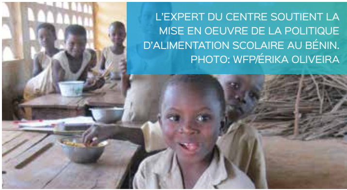
L'EXPERT DU CENTRE SOUTIENT LA MISE EN OEUVRE DE LA POLITIQUE D'ALIMENTATION SCOLAIRE AU BÉNIN.

mondial de nutrition infantile, organisé par le Centre en septembre 2015.