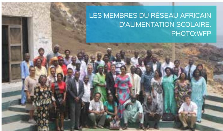
LES MEMBRES DU RÉSEAU AFRICAIN D'ALIMENTATION SCOLAIRE.